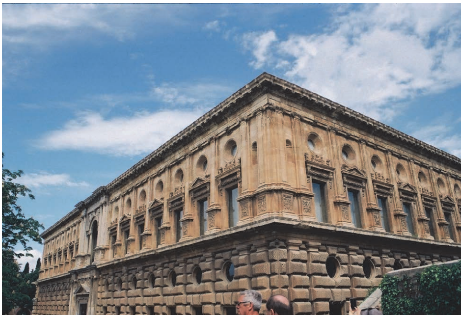
The Palace of Charles I of Spain (Odette Foudral)

Get on your computers to find more information on this period. It is really fascinating.