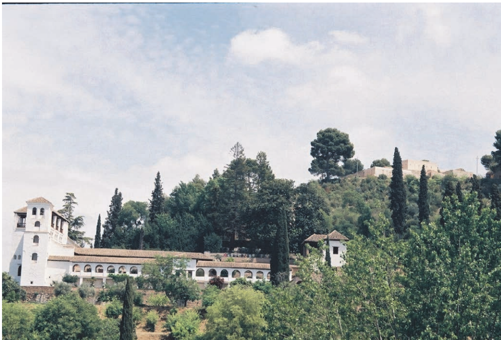
The Generalife