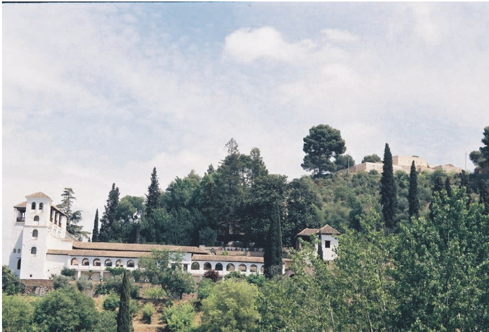
Le Generalife (Odette Foudral)

Et justement, de retour d'une escapade VIP à Grenade (Espagne) organisée par notre amie Valérie, j'ai voulu rafraichir ma mémoire sur la période de 1492. Bien sûr on avait survolé la période à l'école mais sans voir à quel point cette période a enfanté de personnages brillants voire de génies.